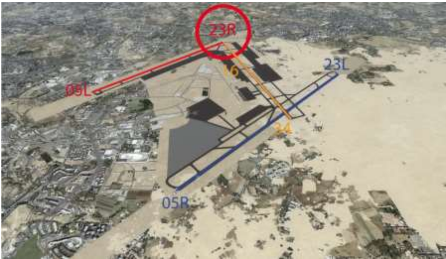
Flughafen Kairo in P3dV5: